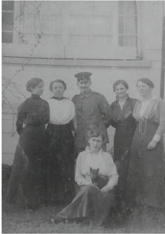
Während des 1. Weltkrieges, im Kreis der Schwestern

1914, mit fast 30 Jahren, wurdest du Soldat im Ersten Weltkrieg aus dieser Zeit gibt es einige Bilder, die dich in Uniform mit „Kameraden“ oder und mit deinen Schwestern zeigen.